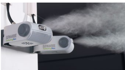
Hochdruckdüsen-Luftbefeuchter als ESD-Schutz

Seit 2009 gehört ein Direkt-Raumluftbefeuchtungssystem bei Zollner zum ESD-Schutzprogramm. Bei einer optimalen relativen Feuchte können elektrische Ladungen problemlos abgeleitet werden. So kommt es nicht zu gefährlichen Ansammlungen von Ladungen und zu einer deutlichen Reduktion von Partikelablagerungen auf den Oberflächen, da die Staubanziehungskraft sehr viel niedriger ist. Zollner fertigt gemäß dem internationalen Standard J-STD001 im Bereich zwischen 30% und 70% relativer Feuchte.