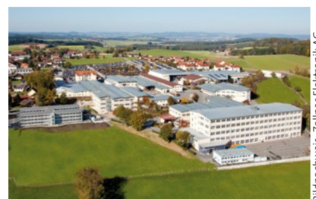
Hauptwerk der Zollner Elektronik AG