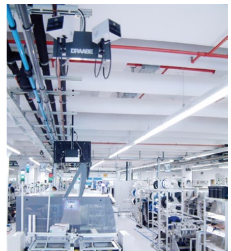
ESD-Schutz: DRAABE TurboFog Vernebler sorgen für eine konstant optimale Luftfeuchte in der Fertigung

Hochvolt- und Hochstromtechnik ist die genaue Einhaltung von Luft- und Kriechstrecken unerlässlich. Als Grundlage dient dabei z.B. der ZVEI-Leitfaden zur technischen Sauberkeit in der Elektrotechnik.