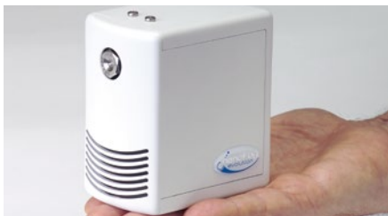
Hochdruck-Luftbefeuchter für jede Raumanforderung