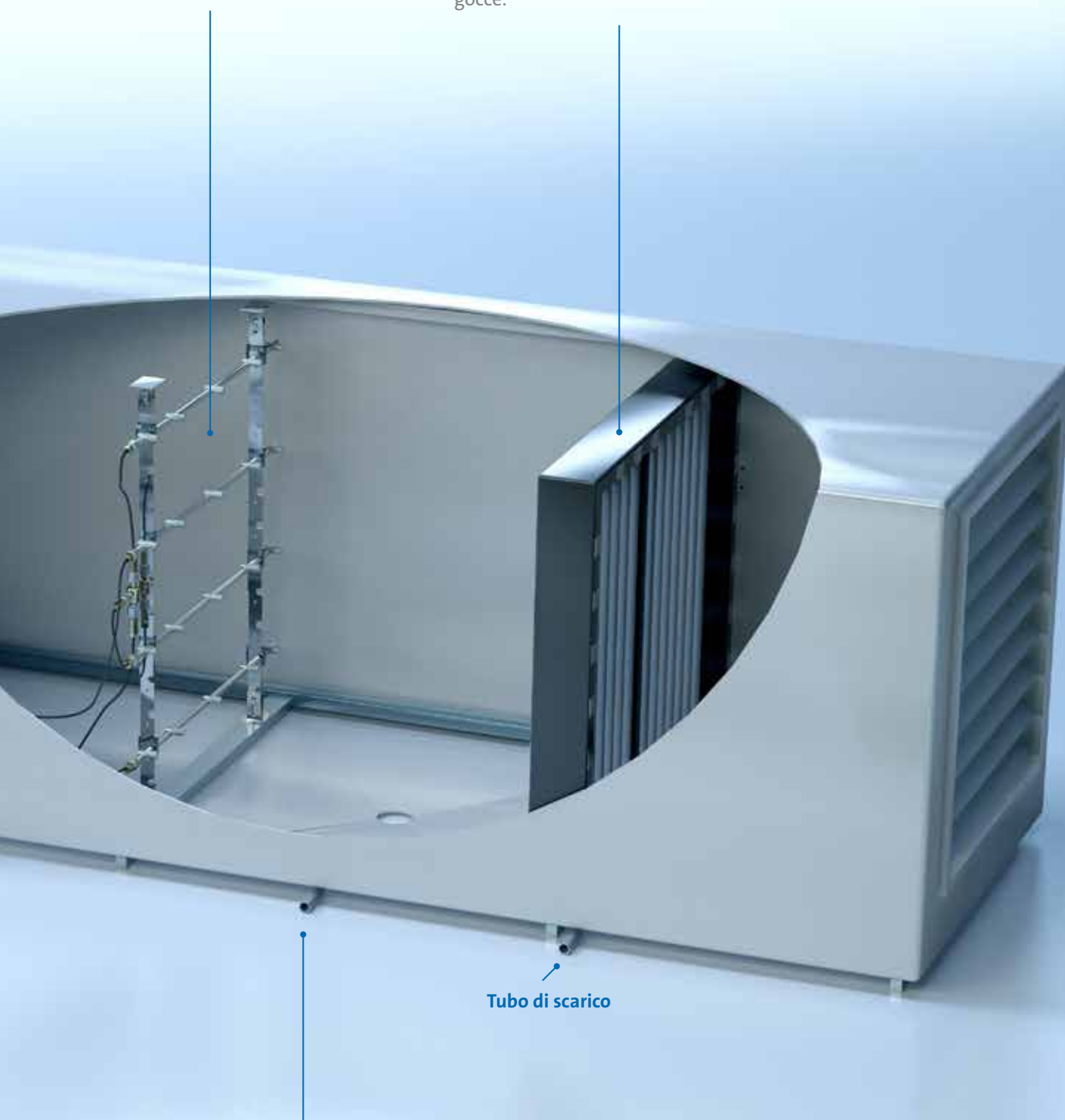
Tubo di scarico

Per evitare trascinalenti indesiderati è possibile utilizzare un separatore di gocce.