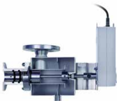
Mantello in Acciaio inox