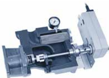
Ghisa sferoidale GGG40

Il sistema di distribuzione del vapore tipo DR73 deve essere preferito quando le sezioni di attraversamento hanno uno sviluppo più quadrangolare o se è disponibile solo un breve spazio per l'assorbimento del vapore. Questa tipologia di sistema viene configurata e realizzata in modo specifico per ogni differente esigenza applicativa.